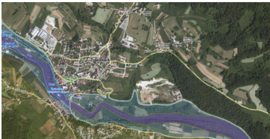
Potek naravne vrednote po južnem robu OPPN (piso)

Po južnem robu OPPN poteka naravna vrednota: Krka, Osrednji dolenski vodotok, desni pritok Save - hidr, geomorf, (geomorfp, geol, zool).